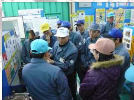
関連会社安全担当者への教育風景

エクセディでは安全人間を育成するために、日本国内はもとより海外グループ会社からも研修生を受け入れています。また、構内工事業者や近隣会社の安全教育の一環として、安全道場の解放を行い、社会貢献の一翼を担っています。