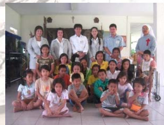
エクセディフリクションマテリアル社員と子供たち

エクセディフリクションマテリアル(タイ)では、地域の児童養護施設において、子供たちとのふれあいと、寄付活動を実施しています。