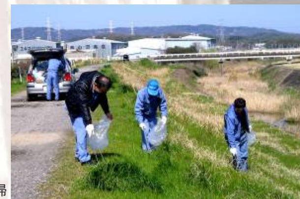
河川やサイクリングコースを熱心に清掃

(株)プロネット(京都府)では周辺地域の清掃活動を定期的実施し、今後も地域への貢献と環境美化を推進します。