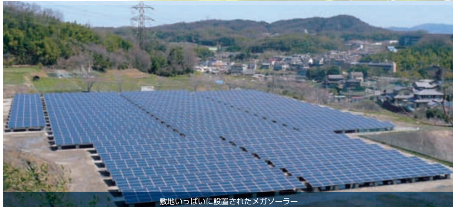
敷地いっぱいに設置されたメガソーラー

エクセディ電設（大阪府）が大阪府枚方市穂谷で1MWのメガソーラー発電所（エクセディ SB 大阪）を開設。発電所を所有することで、発電事業者としてのノウハウを現地現物で吸収していきます。