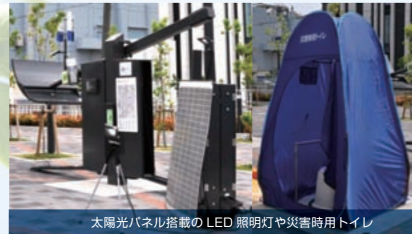
太陽光パネル搭載のLED照明灯や災害時用トイレ

エクセディ防災公園（大阪府）は、本社隣接の当社土地を大阪府と寝屋川市に無償提供させていただき、周辺道路を含め、整備しました。同公園には太陽光パネル搭載のLED照明灯や災害時用トイレなどを完備し、避難場所としての役割を果たします。