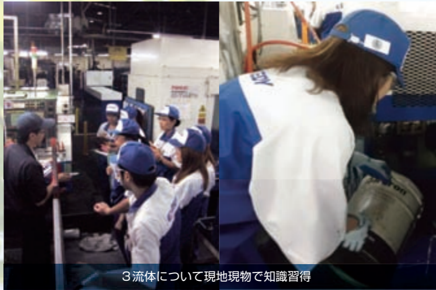
3流体について現地現物で知識習得