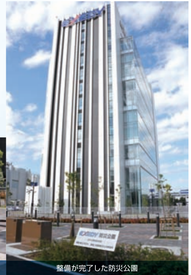
整備が完了した防災公園