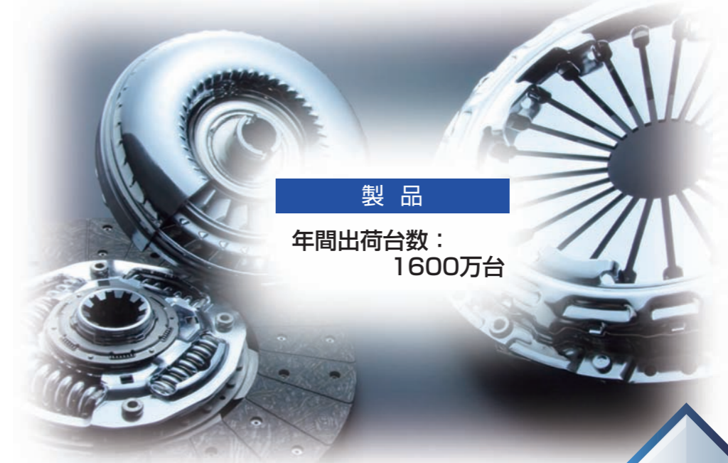
製品 年間出荷台数: 1600万台